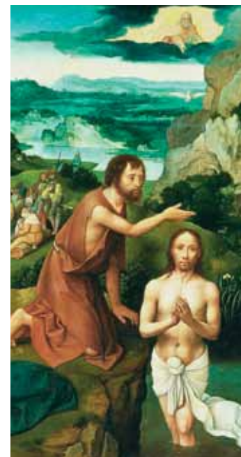
Kristi dåb, malet af Joachim Patenier efter 1515 på egetræ; Kunsthistorisches Museum, Wien.

Dele af teksten er hentet på: www.kristendom.dk